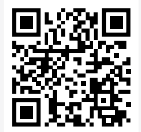
자세한 내용은 QR코드 스캔